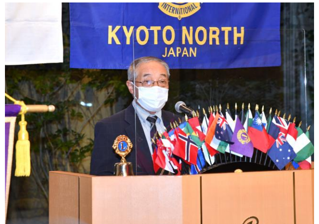
L 古川の今年度アクティビティー発表